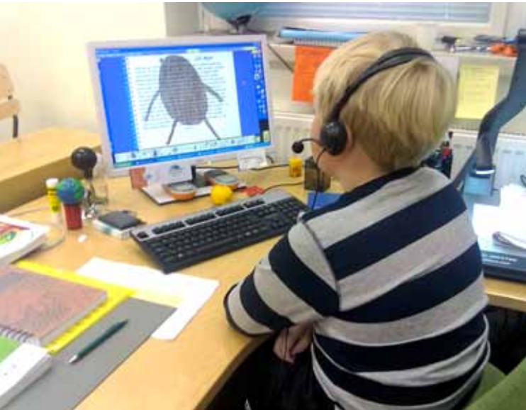
Oppilas lukee satuansa tietokoneelle.