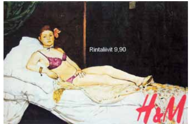
Hetan muokkaama muunnos Olympiasta.

van sisältö muuttuisi mahdollisimman radikaalisti toisenlaiseksi. Lisäämällä tai poistamalla kuvasta kohteita dramaattisesta taulusta voi tehdä huumorikuvan, kanta-aottavasta kuvasta mainoksen tai rauhallisesta tyyssijasta vaarallisen ja yllättävän. Kuvalliset harjoitustyöt viedään digitaalisina oppimisalustan kansioihin ja kurssilaisten keskinäinen palautteenanto voi alkaa.