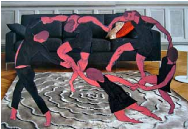
Emman kollaasitekniikalla toteutettu muunnos La Danse -teoksesta.