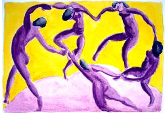
Matissen La Danse sai uudet värit Emman väritutkielmas- sa.