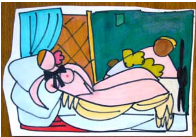
Hetan abstrahointeja Manet'n Olympiasta.