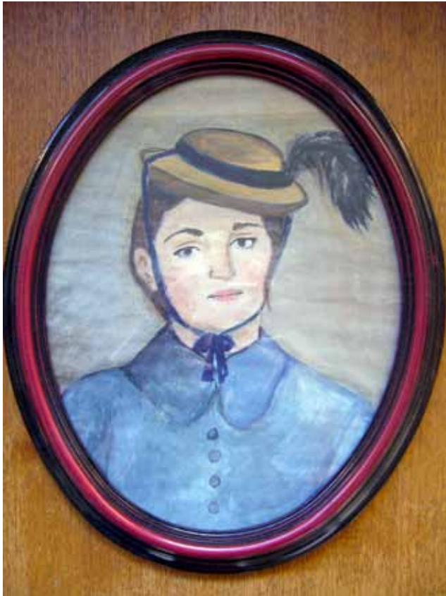
Heta Huttusen kuvallinen kommentti Manet'n Olympia-teokseen.