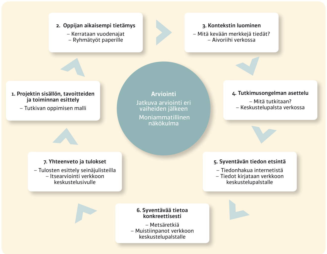
Prosessikaavio Keväinen metsä -projektista.