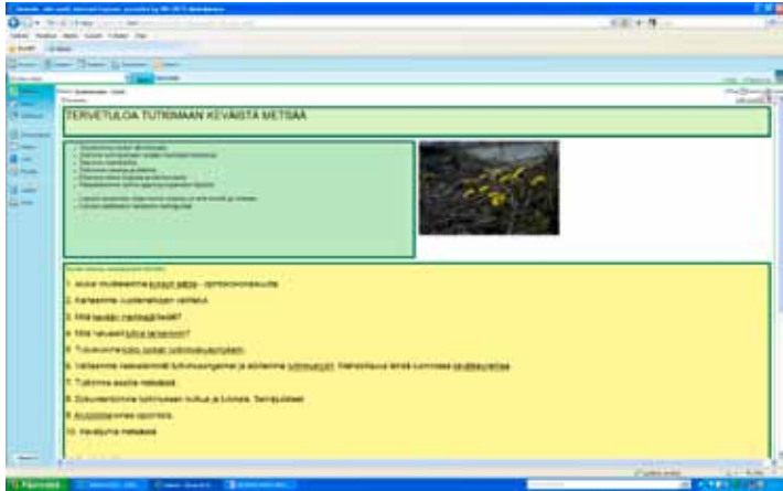
Keväinen metsä -etusivu Fronterissa.