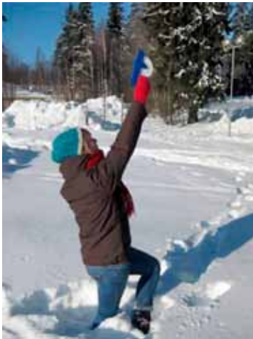
Puun korkeuden mittaaminen.